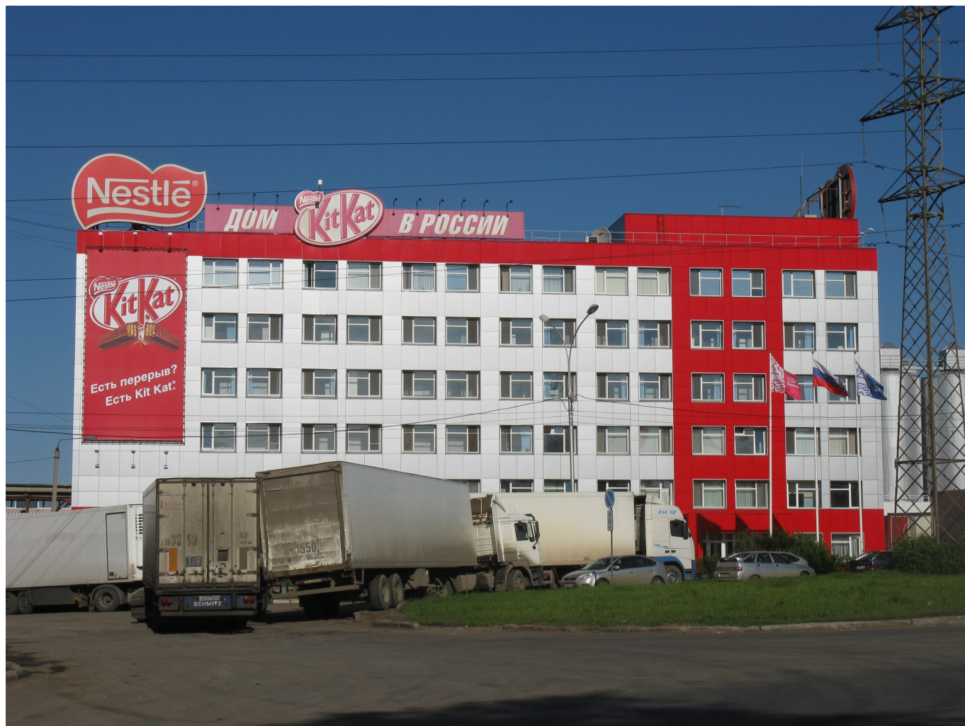
Так выглядит Nestlé Россия в Перми © Википедия

Что же касается России, то сообщается о прекращении рекламной деятельности, о приостановке новых инвестиций, а также импорта и экспорта товаров не первой необходимости. По мнению швейцарского Фонда Ethos, объединяющего пенсионные фонды и занимающегося социально ответственными инвестициями и продвижением принципов устойчивого развития в финансовой индустрии, этой информации явно недостаточно. «Учитывая обязательства, принятые на себя Nestlé, а также репутационные риски, связанные с ситуацией в Украине, акционеры вправе ожидать от Nestlé большей прозрачности в этом вопросе», считает его директор Винсент Кауфманн.