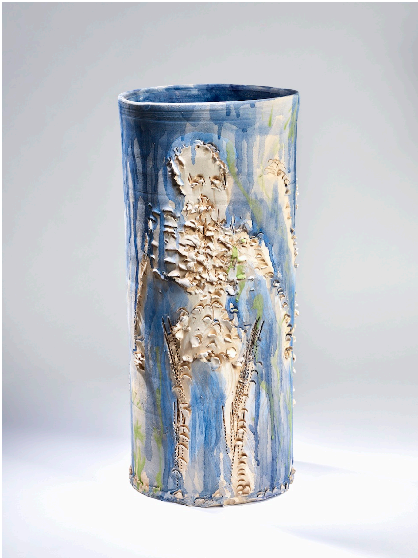
Мигель Барсело, Без названия, 2022 © Miquel Barceló, ADAGP Paris, 2023.

Интересно, что скарификация не ведаёт гендерных различий и наблюдается как у мужчин, так и у женщин, причем на любых частях тела: лице, груди, спине, плечах,