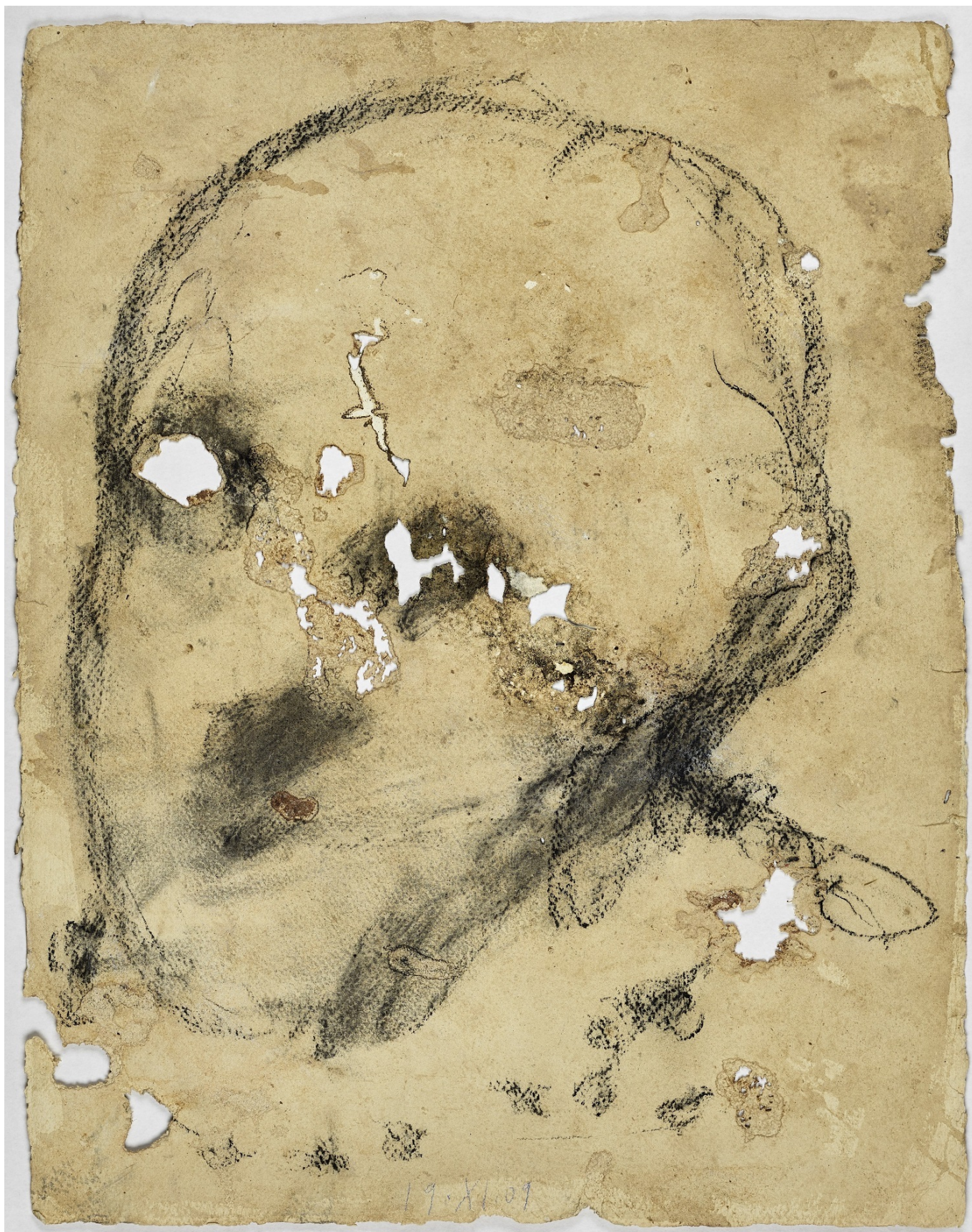
Мигель Барсело, De Vamon, 2009 © Miquel Barceló, ADAGP Paris, 2023.

Концепт выставки – столь модный в музеографии сейчас и совсем не модный пятнадцать лет назад «диалог». На этот раз – диалог между предметами из собрания музея и творениями Мигеля Барсело, которые сам художник рассматривает как плоть, которую он деформирует, разрывает, колет или раскрашивает... Что