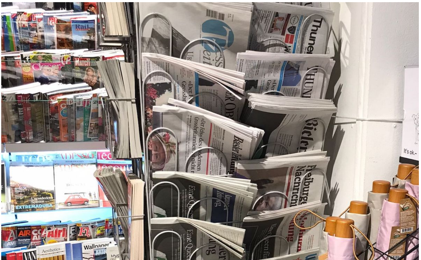
Фотография Елизаветы II - на главной странице всех швейцарских газет

Президент Швейцарской Конфедерации Иньяцио Кассис, воздавая должное королеве Елизавете II, выразил свое восхищение ею, назвав ее «компасом мира» и отметив, что с ее уходом «мир потерял якорь». Он был одним из последних глав государств, встретившихся с королевой. Их встреча прошла 28 апреля в Виндзорском замке. Иньяцио Кассис прибыл в Лондон для переговоров о заключении соглашения о свободной торговле и был польщен тем, что его приняла королева. «Она сияла радостью жизни, хотя мы знали, что она уже была хрупкой», - подчеркнул швейцарский президент.