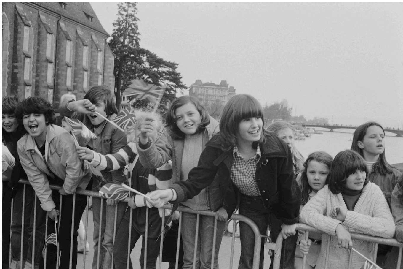
Так встречали Елизавету II в Швейцарии

Меры предосторожности были необычными для того времени, что было связано с опасениями в отношении Ирландской республиканской армии (ИРА), которая могла совершить террористический акт против главы Великобритании. Помимо многочисленных телохранителей монаршую чету в Швейцарии охраняли полицейские. Например, в Берне дорога к Федеральному дворцу был оцеплена на время проезда королевского кортежа. В Цюрихе были закреплены даже крышки люков на тротуарах, а когда несколько цюрихских смутьянов захотели подпортить королевский визит, громко включив рок-музыку на крыше, полиция без лишних слов отключила им электричество.