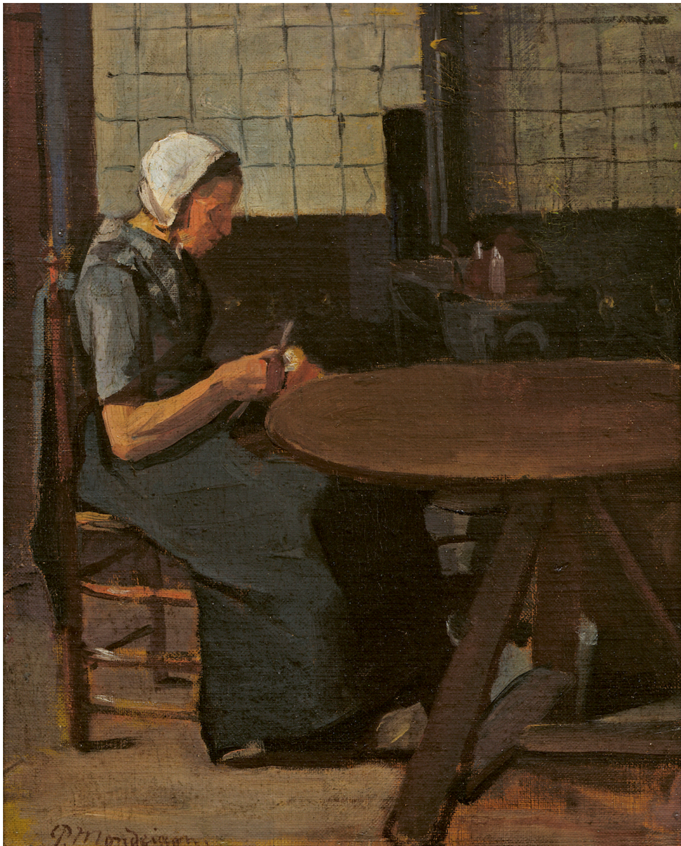
Пит Мондриан. Женщина с веретеном, ок. 1893-1896 гг. Предоставлено галереей Pace. © 2022 Mondriaan/Holtzman Trust.

В начале 1910-х годов Мондриан увлекся цветом. На его полотне «Красное облако» 1907 года запечатлен волшебный момент, когда заходящее солнце окрашивает облако в ярко-красный цвет, в то время как небо остается ярко-синим. Эта картина принадлежит к группе работ, которые Мондриан писал в сумерках, когда оттенки быстро меняются. На автопортретах 1908 года он также изображает себя в сумерках