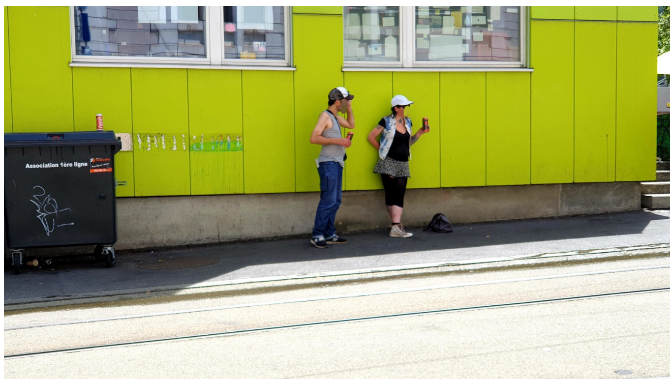
Будний день. Маргиналы челят.

Там было очень интересно уже до начала занятий. Интересно, но непонятно. Сложное расписание, голубые, зеленые, оранжевые комнаты, мастер-классы, театры, разговорный клуб, outdoor активности. Я попросил консультацию у преподавателя на английском, но тот говорил только на испанском или французском. И это было логично: в тот день среди 16 учеников было 14 колумбийцев, ваш покорный слуга из Украины и Татьяна (имя изменено) из Молдовы, лет пятидесяти. Она и пришла мне на выручку.