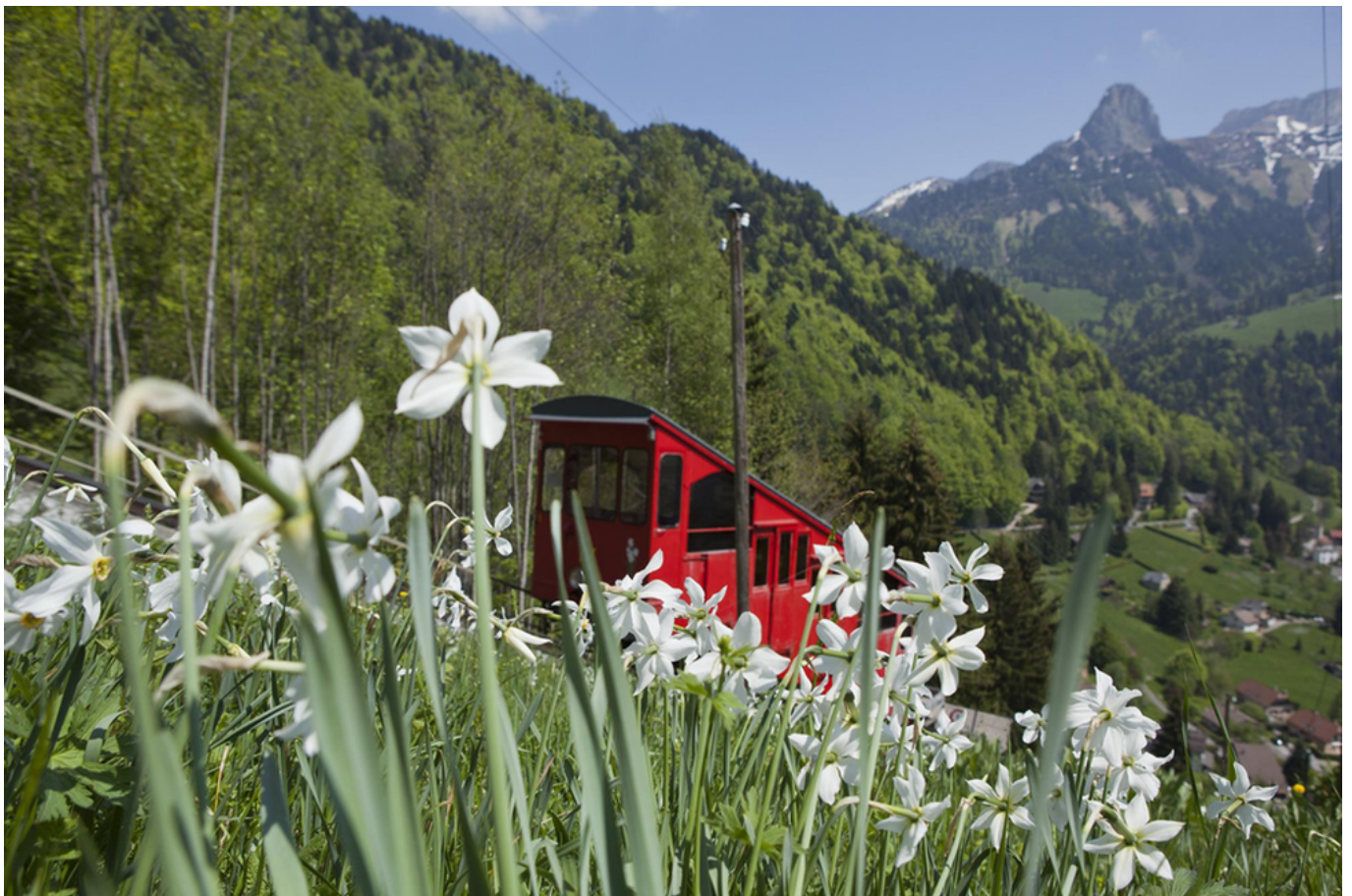
Фуникулер Лез Аван – Сонлу

Author: Наталья Беглова, Монтре , 20.05.2022.