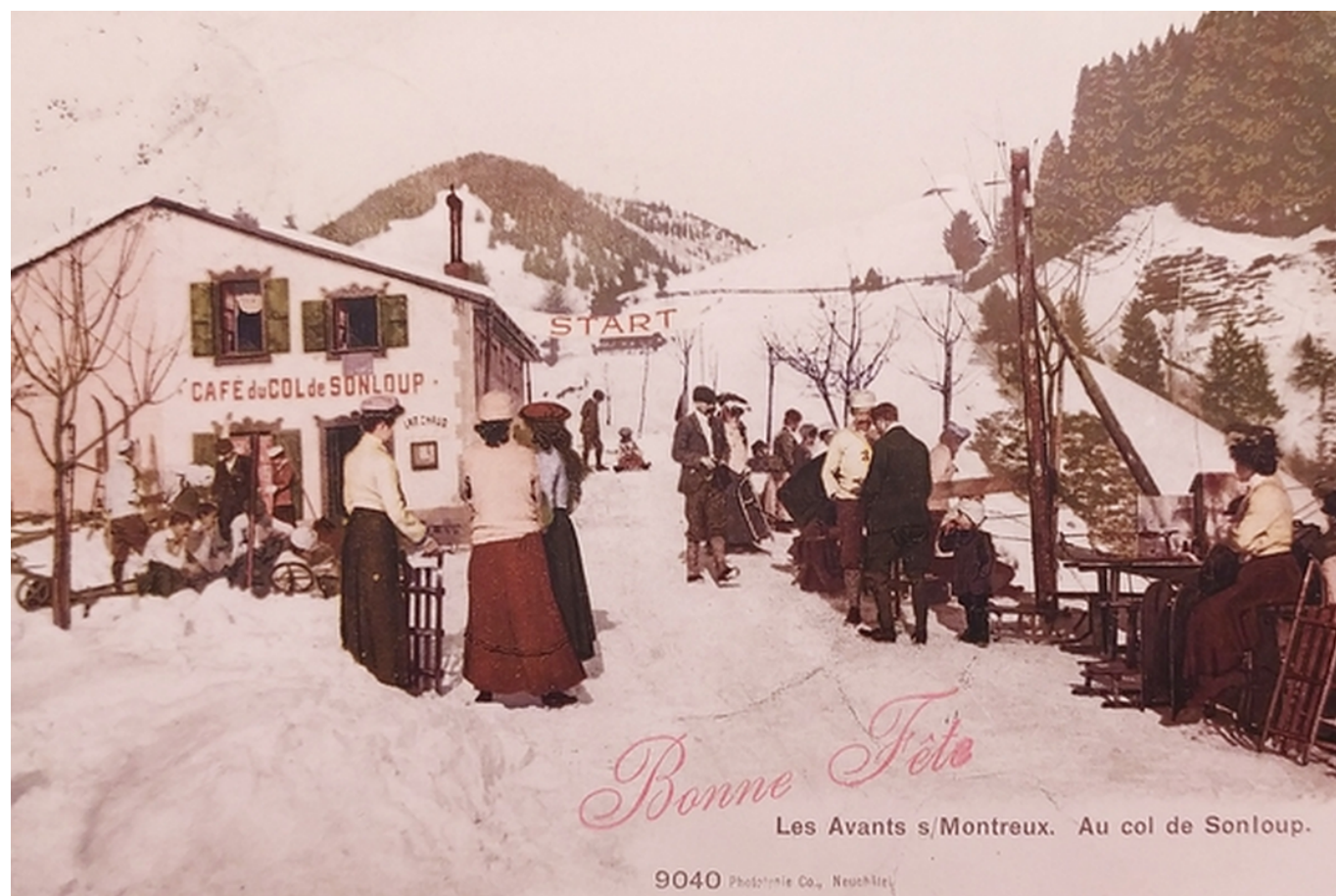
Коль-де-Сонлу. Отсюда начинали спуск на санках и лыжах. Фотография начала XX века

В дальнейшем Хемингуэй побывает и на более знаменитых швейцарских курортах, но по-настоящему счастлив он был именно в скромных деревушках над Монтрё. О них писатель будет с ностальгией вспоминать много лет спустя в своей книге «Праздник, который всегда с тобой», написанной за несколько лет до смерти. Именно эти места описаны в его знаменитом романе «Прощай, оружие!», в рассказах «Посвящается Швейцарии», «Кросс по снегу» и очерке «Рождество на крыше мира». Лез Аван и Шамби навсегда останутся любовью Хемингуэя. И писателя можно понять: где еще можно одновременно порезвиться в снегу и тут же оказаться на лугу, наполненному благоуханьем нарциссов!