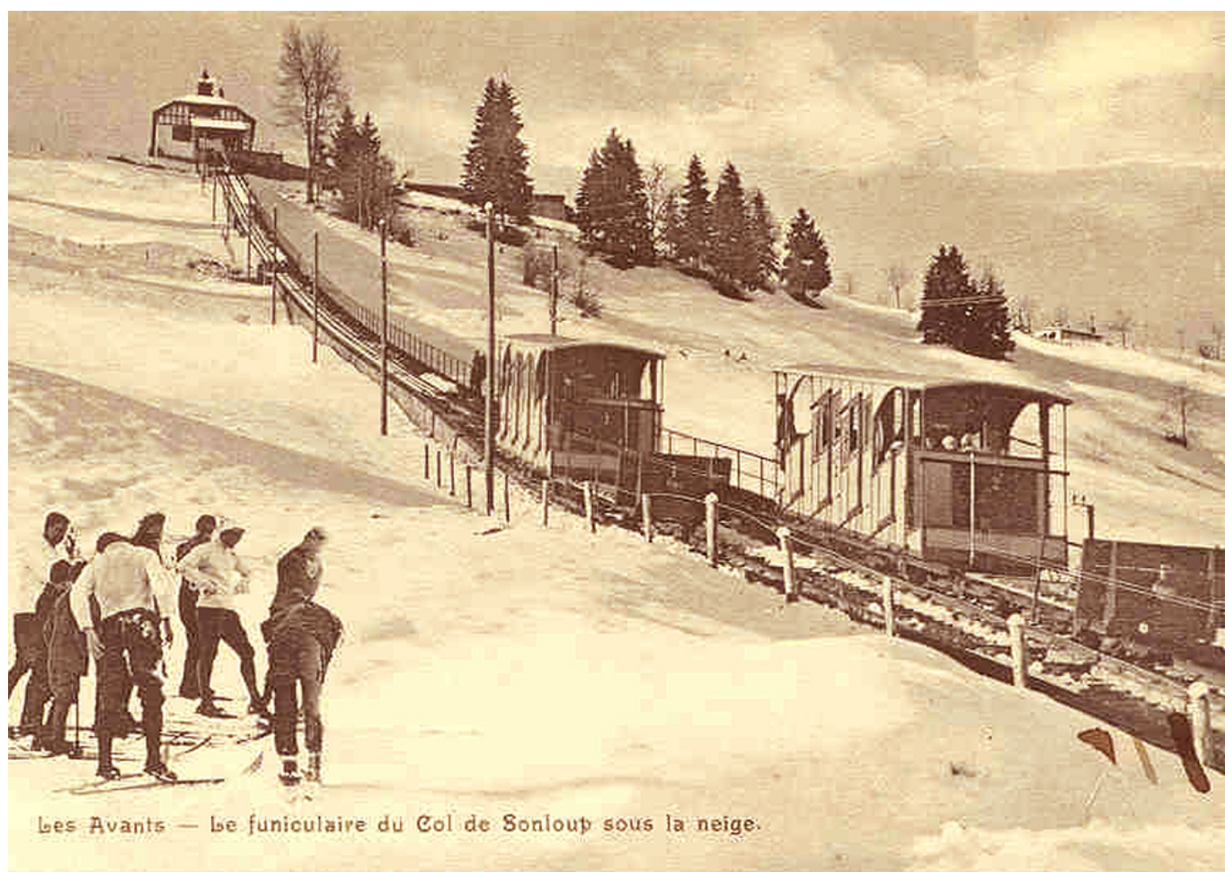
Лез Аван. Фуникулер поднимается на Коль-де-Сонлу. Фотография начала XX века

Есть еще один повод отправиться именно в Лез Аван: там в период цветения нарциссов побывал Лев Николаевич Толстой. В 1857 году он останавливался в Кларане и совершил восхождение на гору Дан-де-Жаман, а по дороге заглянул в деревню Лез Аван полюбоваться цветочными полями. Эти места, как явствует из дневника писателя, показались ему достойными пространныго описания: «Avants состоит из десятка швейцарских домиков, разбросанных у подошвы Jaman, перед началом глубокого заросшего оврага, который идет до самого Монтрё, на широкой просторной зеленой поляне, буквально усеянной нарциссами. Кругом темные дубовые и сосновые рощи, вверху скалистый зуб Жаманский, внизу открывается дом Риги, несколько шале и уголок синего далекого озера и лощины, с исполосанной дорогами, изгородями и Роной долиной Вале. Несколько потоков шумят около домов».