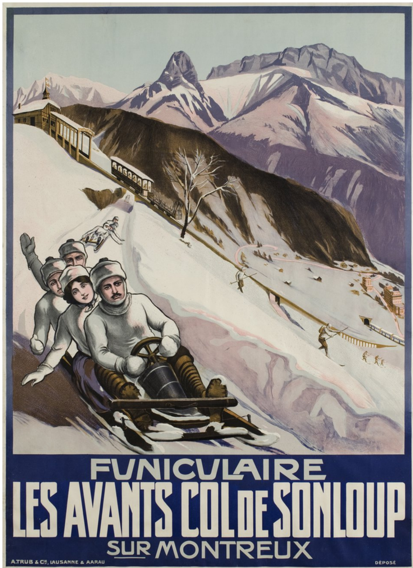
Одна из первых афиш, рекламирующих занятия зимними видами спорта, подготовленная в связи с открытием фуникулера Лез Аван – Сонлу в 1910 году.