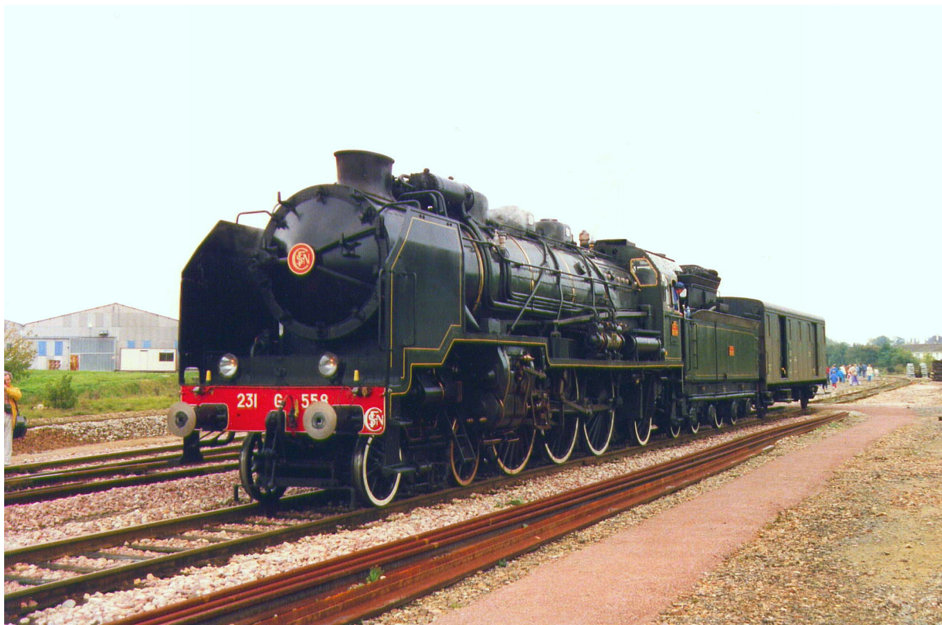
Так выглядел паровоз Pacific-231, вдохновивший Онеггера

тогда воплотить в звуках яркий урбанистический образ - мощного паровоза, с силой рассекающего пространство.