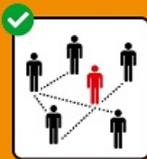
Fournir les coordonnées complètes pour le traçage.