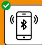
Interrompre les chaînes de transmission avec l'application SwissCovid.