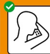
Tousser et éternuer dans un mouchoir ou dans le creux du coude.