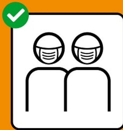
Porter un masque si on ne peut pas garder ses distances.