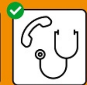
Se rendre chez le médecin ou aux urgences seulement après avoir téléphoné.