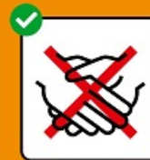
Ne pas se serrer la main.