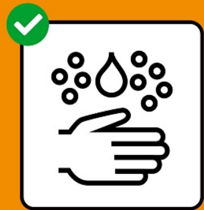
Se laver soigneusement les mains.