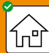
Test positif : isolement. Contact avec une personne testée positive : quarantaine.