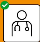
En cas de symptômes, se faire tester immédiatement et rester à la maison.