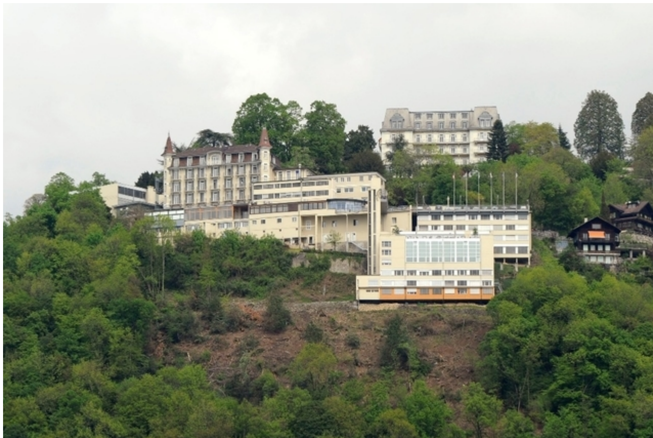
Институт Глиона