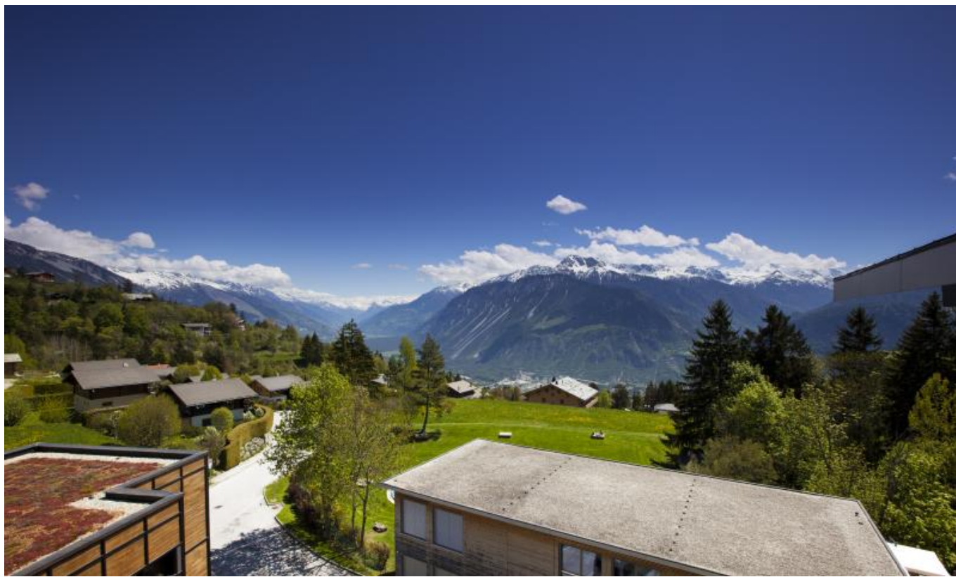
Les Roches: обучение на лоне природы ( lesroches.edu )

многие юноши и девушки не чувствуют влияния кризиса. Среди них – выпускники Школы гостиничного бизнеса Лозанны (EHL), Института высшего образования в Глионе (кантон Во), Университета отельного менеджмента, ресторанного бизнеса и туризма Les Roches в Кран-Монтане (кантон Вале).