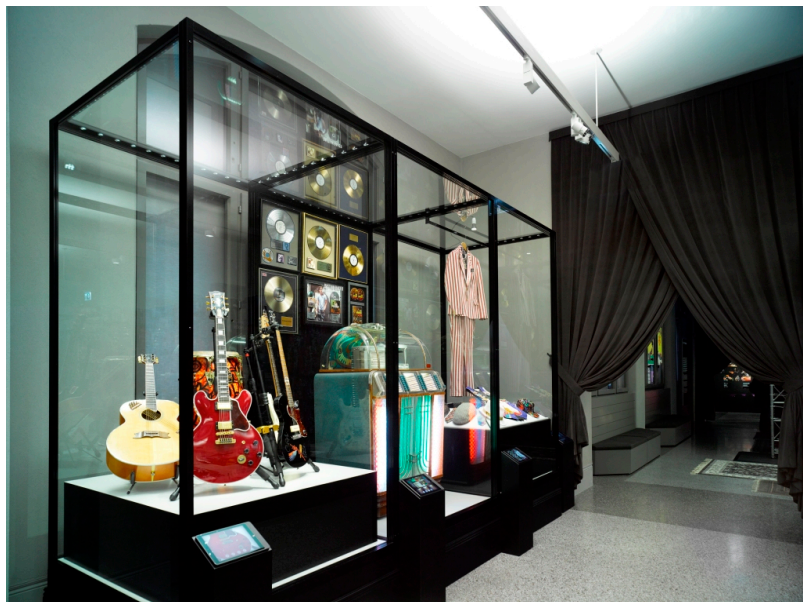
На выставке

Напомним, что в 2013 году уникальная коллекция архивов фестиваля, которая хранится в фонде Клода Нобса, была включена в реестр документального наследия в рамках программы «Память мира» ЮНЕСКО. Как отметила тогдашний генеральный директор ЮНЕСКО Ирина Бокова: «Джаз – это больше, чем музыка, это – универсальное послание мира, в котором гармонично слились ритм и значение, которое заключает в себе ценности, важные для каждой женщины и каждого мужчины, предоставляя уникальные возможности для взаимопонимания посредством прослушивания, игры и импровизации».