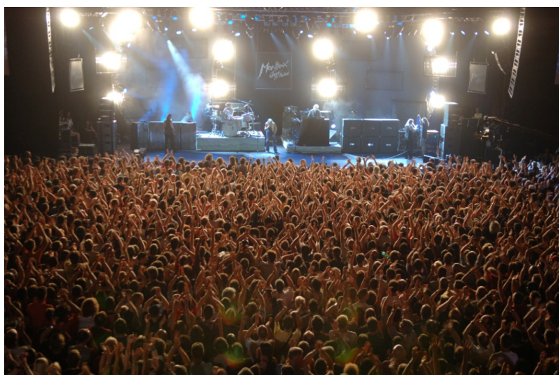
Выступление Deep Purple в Монтре

Дэвид Боуи, Майлз Дэвис, Deep Purple, Нина Симон, Queen – перечислять звезд, которые выступали в Монтре, не имеет смысла, легче было бы назвать тех, кто не выходил там на сцену хотя бы один раз. Знатоки джаза хорошо знают своих кумиров, а те, кто только обратил внимание на этот музыкальный жанр, могут расширить кругозор, посетив выставку.