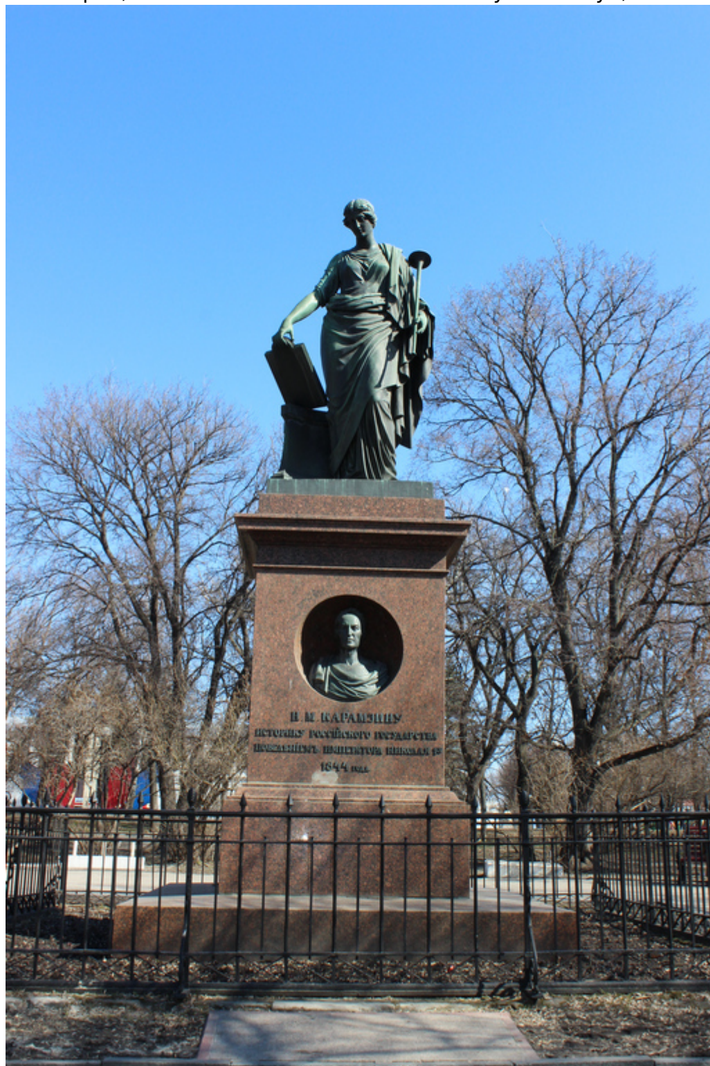
Памятник Н. М. Карамзину в Ульяновске

Одним словом, друзья мои, путешествие питательно для духа и сердца нашего. Путешествуй, ипохондрик, чтобы исцелиться от своей ипохондрии! Путешествуй, мизантроп, чтобы полюбить человечество! Путешествуй, кто только может!».