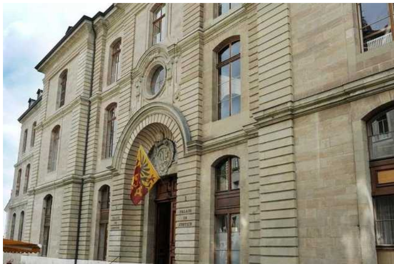
Женевский дворец правосудия