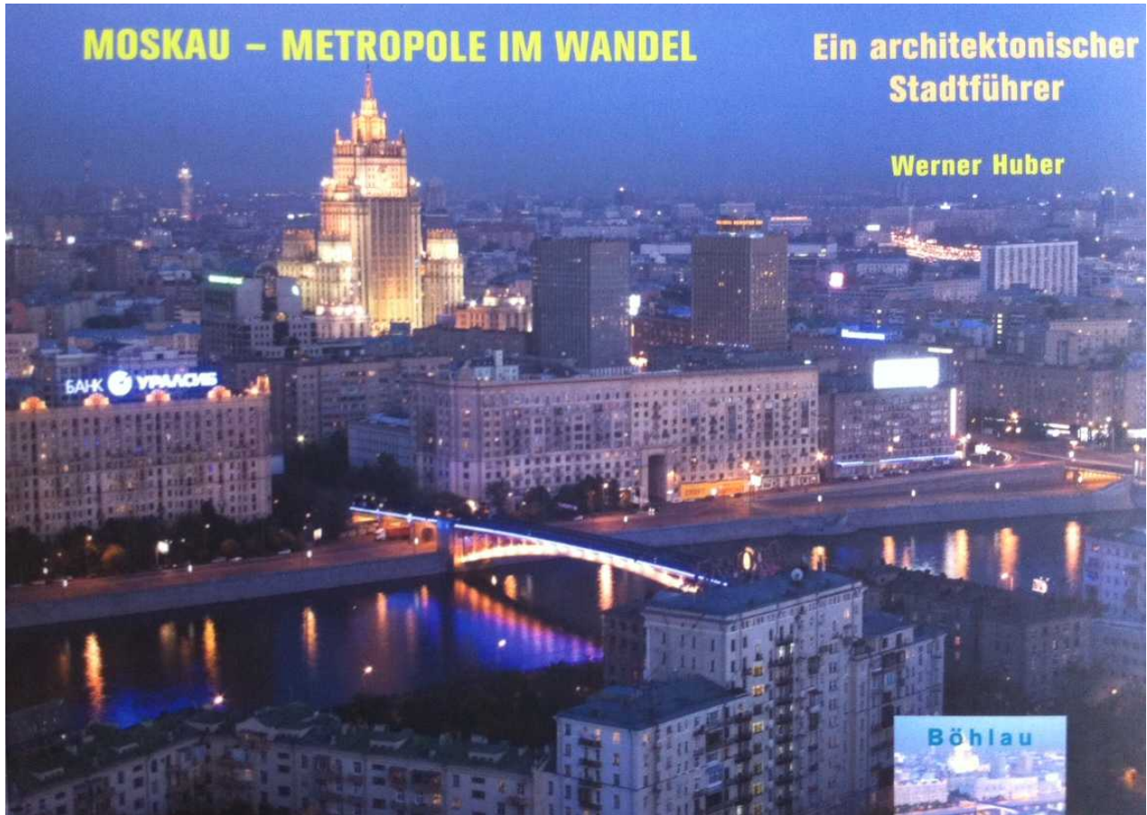
Обложка книги Хубера