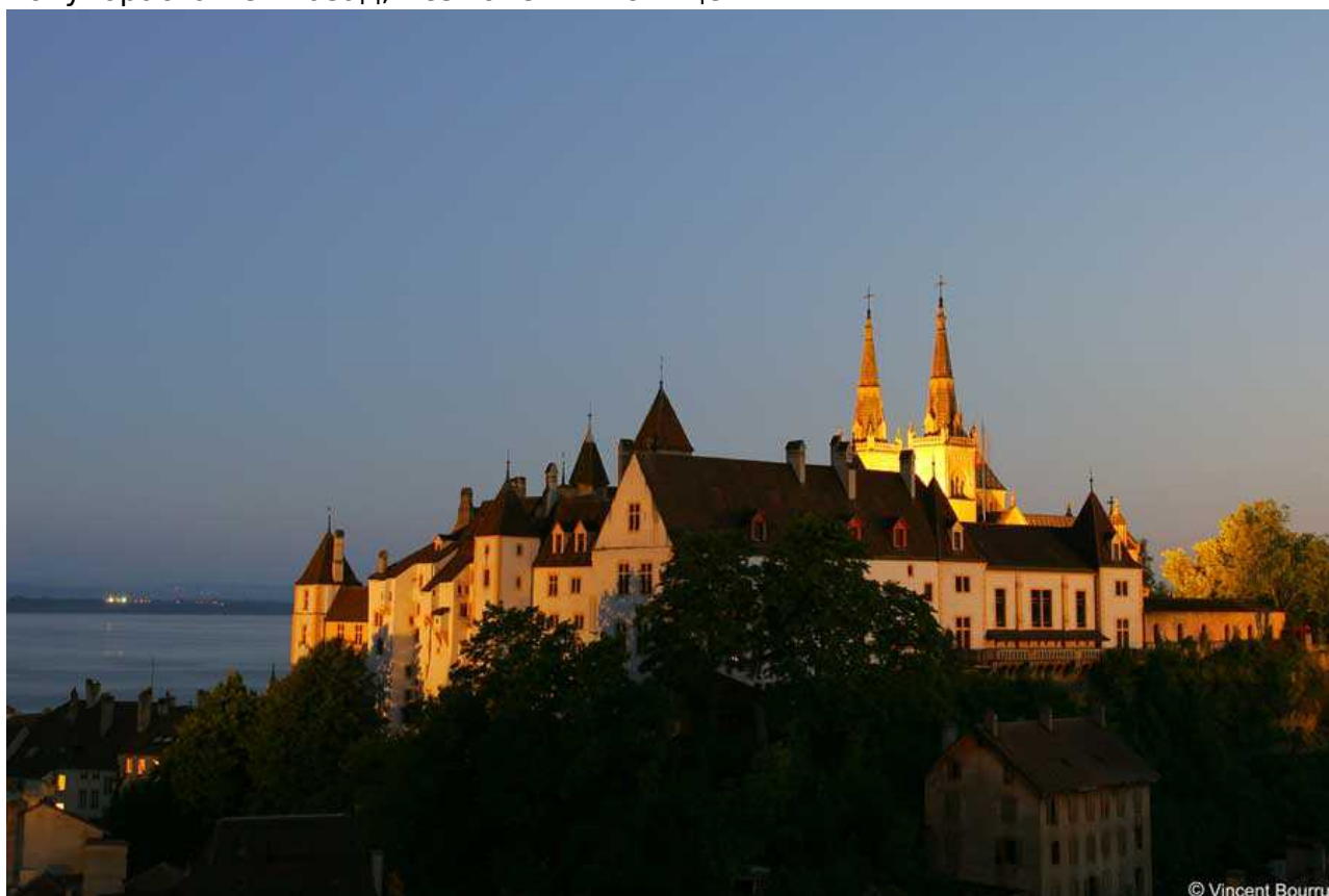
Невшательская цитадель во всей своей красе

Что же, по всей видимости, семейные традиции в Швейцарии и сегодня, как и более полутора столетия назад, незыблемы и священны.