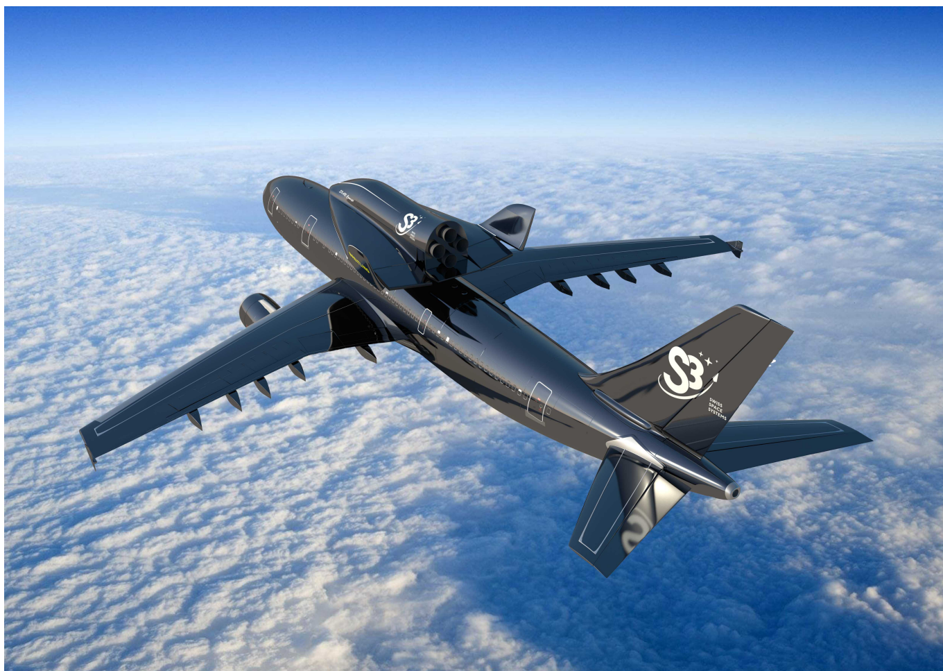
фото с сайта s-3.ch

Author: Татьяна Гирко, Фрибург , 15.03.2013.