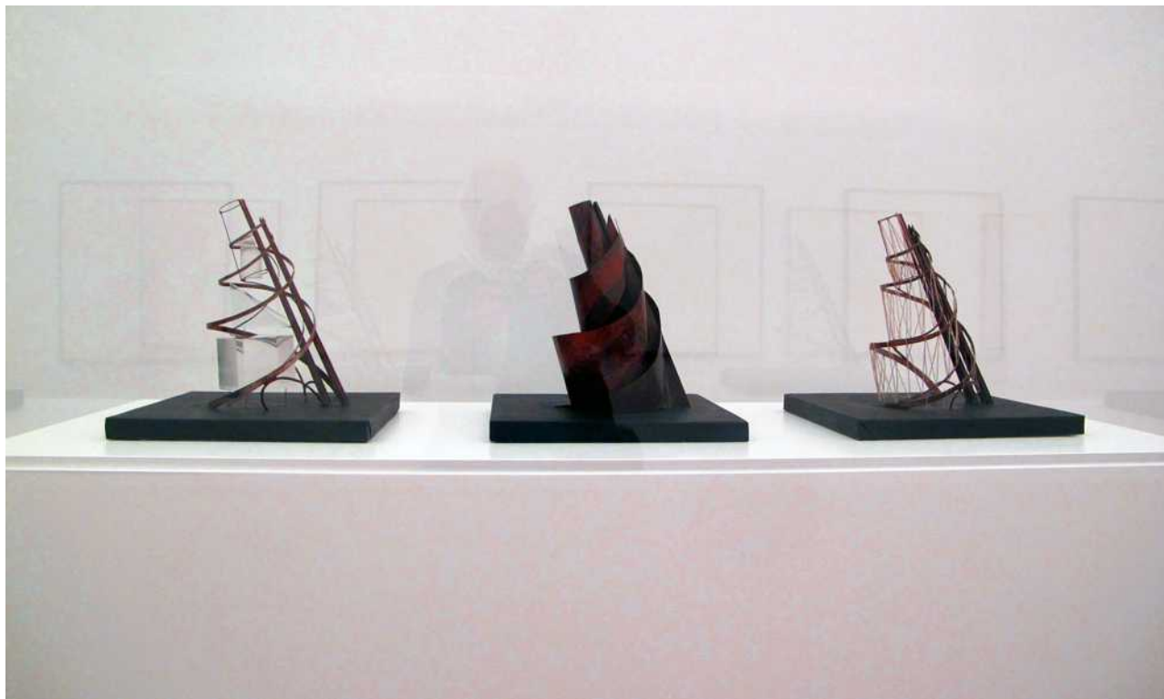
Уменьшенные модели Башни