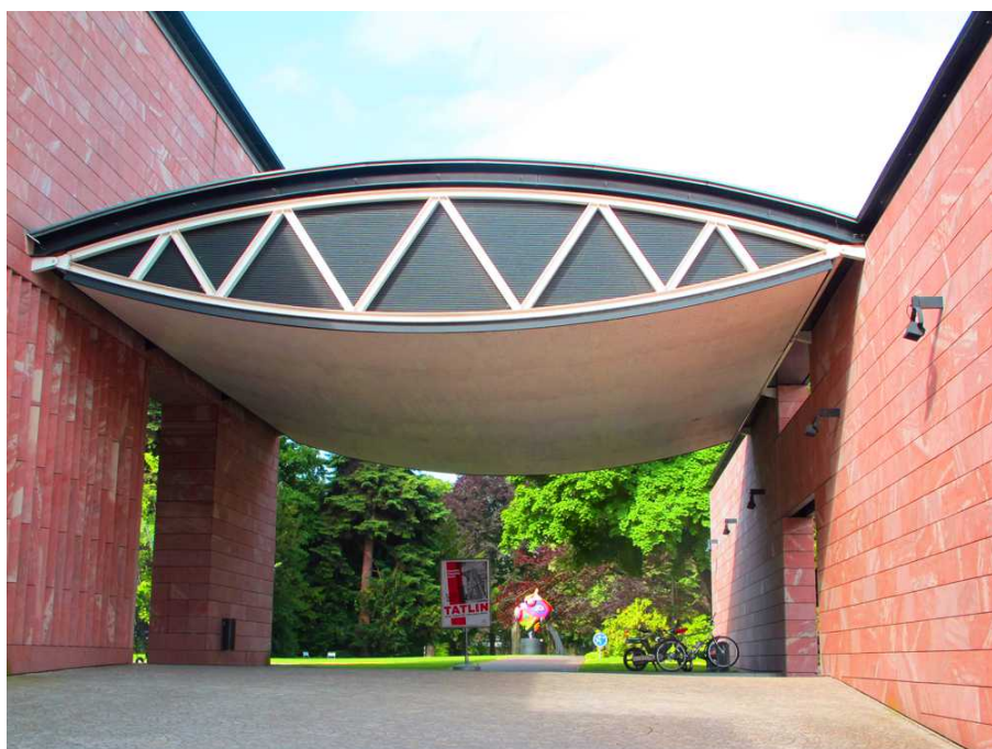
Вход в Музей Жана Тэнгли