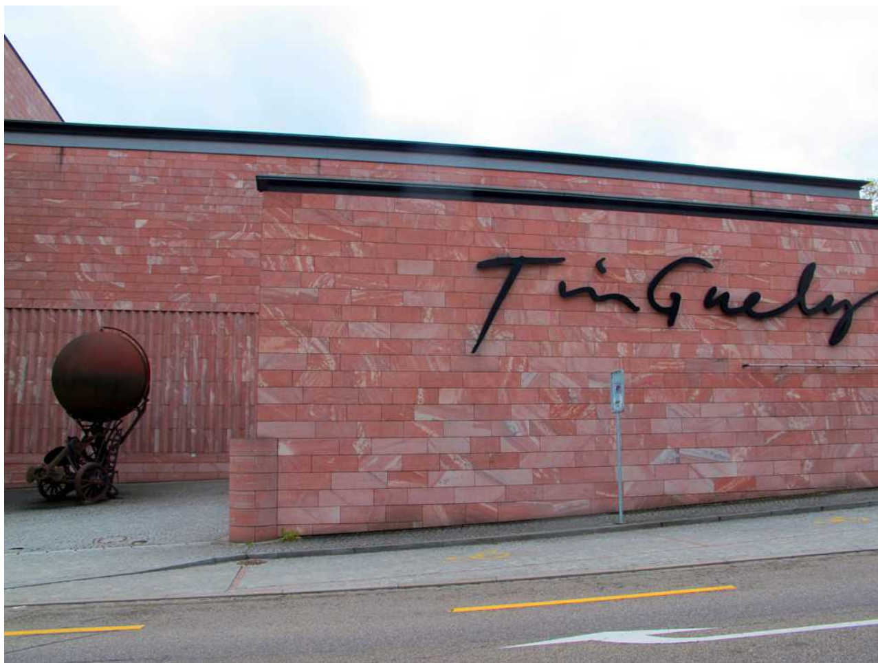
Музей Жана Тенгли в Базеле

Стоимость билетов: Взрослые: CHF 15 Школьники и студенты: CHF 10 Дети до 16 лет в сопровождении одного взрослого: бесплатно. Тех, кто еще не решил, стоит ли ехать, приглашаем посетить нашу фотогалерею .