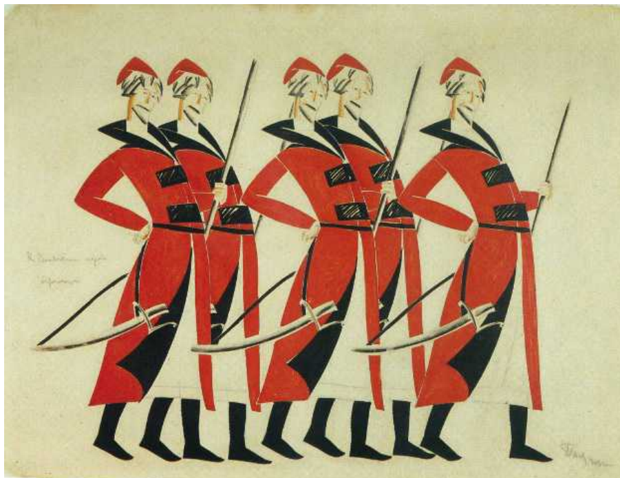
«Стрельцы», эскиз к опере Ф. Глинки «Жизнь за царя», 1913.

Памятник III-му Коммунистическому Интернационалу можно назвать предтечей кинетического искусства. Поэтому логично, что наиболее полная персональная выставка Владимира Татлина пройдет в Музее Тэнгли, носящего имя классика кинетического искусства, духовного сына конструктивиста Татлина, о котором мы уже подробно рассказывали . Причудливые «живые» механизмы швейцарского художника можно наблюдать в соседних с татлинской экспозицией залах. Связь времен и культур здесь очевидна.