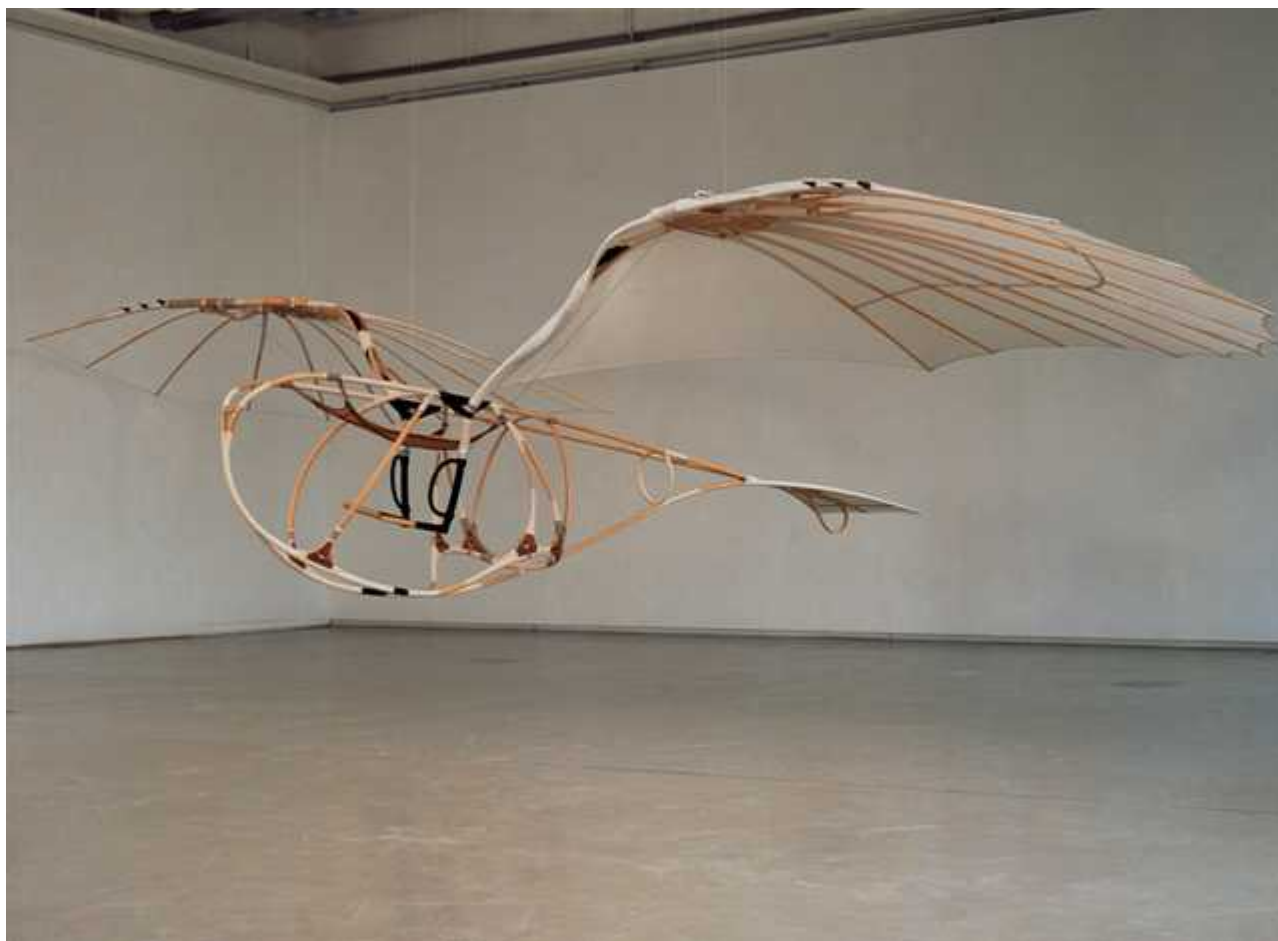
«Летатлин», 1929-1932.