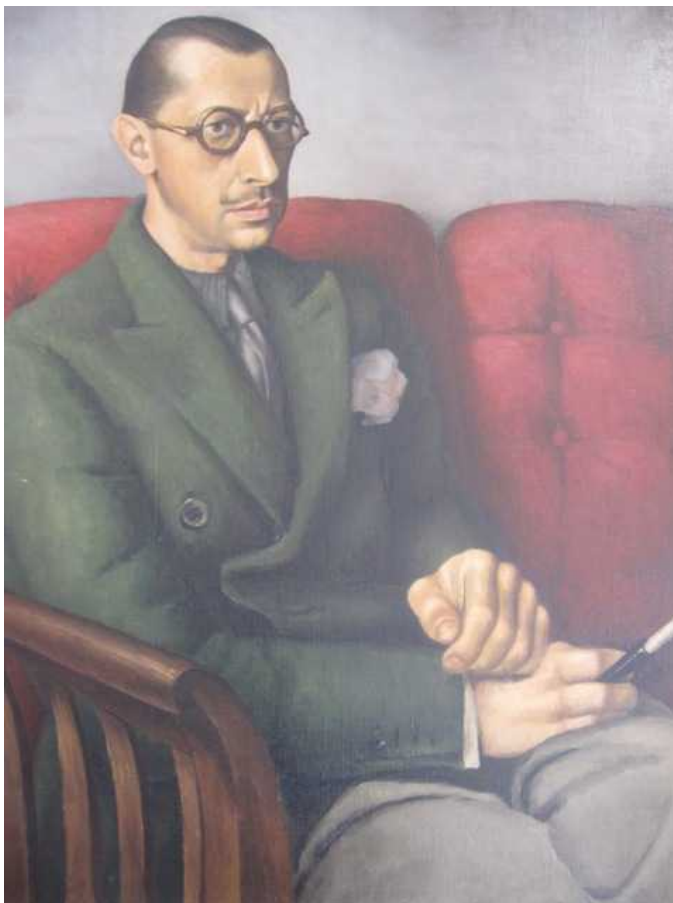
Портрет Игоря Стравинского работы его сына Теодора, 1929

Наверное, пришедшее с возрастом осознание принадлежности к династии людей, наделенных выдающимися и разнообразными талантами. Знаете, детство мое было очень скромным, и я об этом как-то не задумывалась. Зато моих детей я воспитываю по-другому и очень радуюсь, что эта тема их интересует.