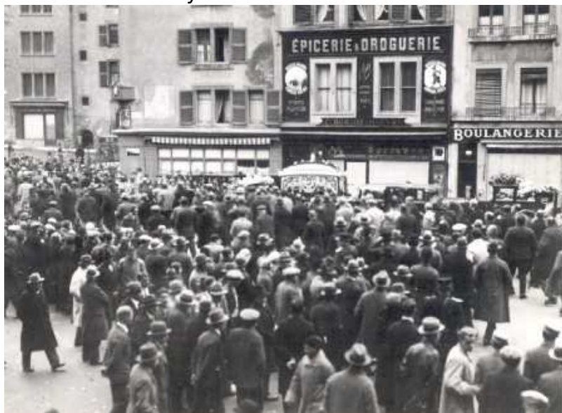
Начало митинга Национального Союза

деревьями, а в 1662 году, после демонтажа городских фортификаций, она приняла уже современные, знакомые нам очертания. В 1848 году Пленпале приобрел статус Женевской коммуны.