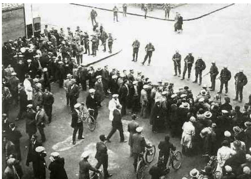
Расстрел мирных демонстрантов на площади Пленпале 9 ноября 1932 года

Проходя мимо вереницы булочных, кондитерских, «бутербродных» и «круассанных» магазинчиков бульвара Пон-д'Арв на подступах к корпусу UniMail Женевского университета, с левой стороны в доме под номером 35 можно заметить скромную вывеску: Musée du Vieux Plainpalais (Музей Старого Пленпале). Та же вывеска гласит, что музей расположен на втором этаже сего старинного здания и открыт он по средам и четвергам с 14.00 до 17.00. Часы работы, впрочем, не властвуют над скромным музеем, созданным в 1892 году усилиями Ассоциации любителей старины Пленпале. При первой попытке проникнуть в помещение заветного хранилища, выяснилось, что упомянутые поклонники женевской старины удалились на покой, и разыскивать их пришлось по всему зданию. Ведь жизнь в городе Кальвина нетороплива, скромна и тиха – об этом расска