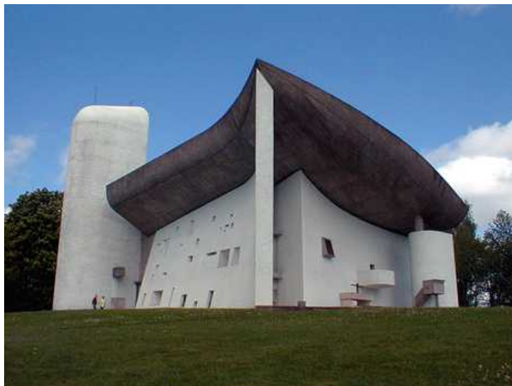
Часовня Ле Корбюзье в Роншаме

Не последнюю роль сыграло негативное мнение о досье Международного совета по сохранению памятников и достопримечательных мест (Icomos), «предпоследней инстанции» перед решающим совещанием. Критика экспертов Icomos, по сообщению французской газеты «Le Monde», пристально следящей за развитием событий, заключалась в выборе объектов досье и аргументов для защиты. Из представленных на суд 19 произведений, призванных иллюстрировать уникальный вклад Ле Корбюзье в историю современной архитектуры и обновление традиций городской застройки, 12 были сочтены недостаточно «исключительными». Упрекнув досье в существенных упущениях, эксперты, словно противореча самим себе, предложили французам сократить кандидатуру до трех отдельных произведений архитектора и не претендовать на большее.